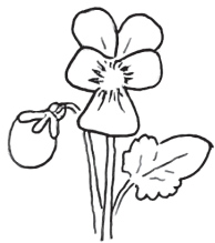
Stedmoderblomst Viola tricolor