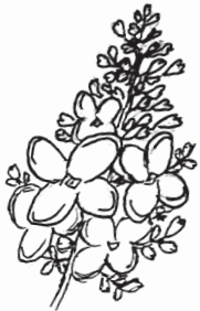
Syren Syringa vulgaris

Havetip Så efterafgrøder og efterårsurter såsom asiatisk kål, rucola, honningurt, kløver, salat m.m.