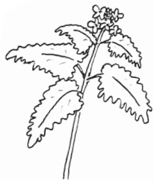
Løgkarse Alliaria petiolata