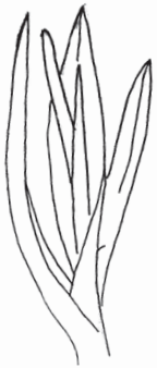
Babington porreløg Allium ampeloprasum