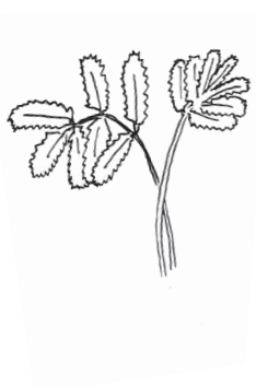
Kvæsur Sanguisorba officinalis