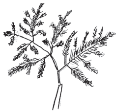
Bronzefennikel Foeniculum vulgare