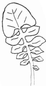
Vinterkarse Barbarea vulgaris