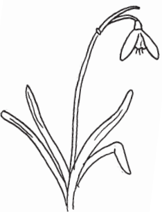
Vintergæk Galanthus nivalis